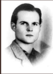
Matók Leó (1928–1951)